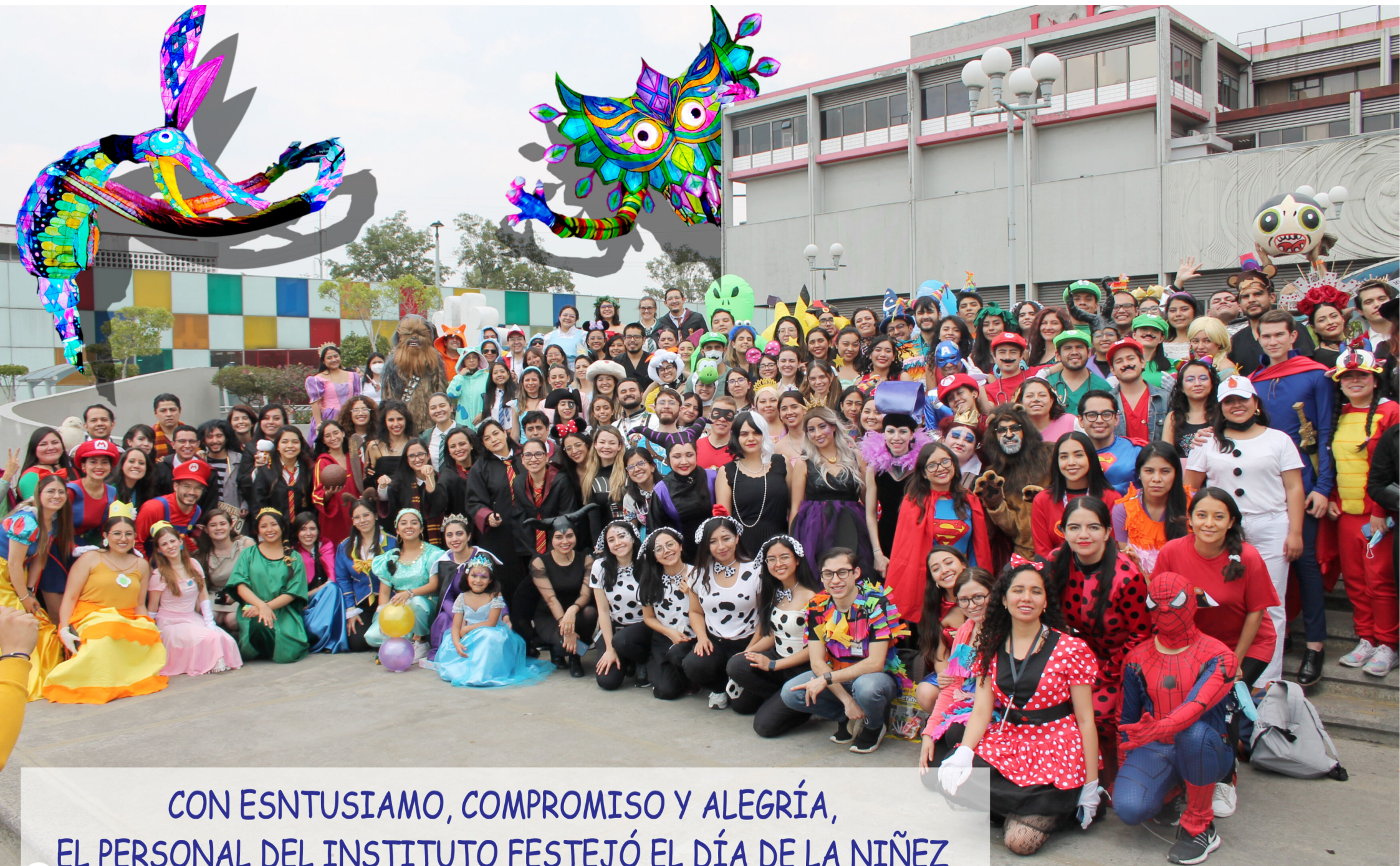
CON ENTUSIASMO, COMPROMISO Y ALEGRÍA, EL PERSONAL DEL INSTITUTO FESTEJÓ EL DÍA DE LA NIÑEZ