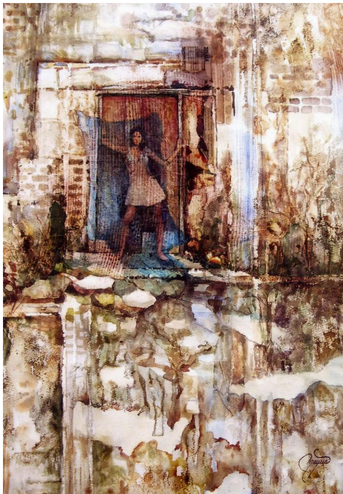
Autora: María Eugenia Anduaga Título: Implacable

El desafío más importante del Programa de Cultura Institucional que impulsan la SFP y el INMUJERES es consolidar el desarrollo e implantación de acciones alineadas con los factores antes descritos y comenzar un proceso de cambio en la Administración Pública Federal en la que cada una de las dependencias y entidades que la integran se sumen para hacer realidad una cultura de igualdad entre mujeres y hombres en beneficio de la sociedad.