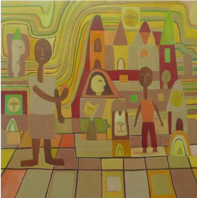
Autora: Anabella Suinaga Título: La pelota

Igualdad es un principio ante la ley que establece que todos los hombres y mujeres son iguales ante los marcos jurídicos, sin que existan privilegios ni prerrogativas hacia unas personas en particular. Es un principio esencial de la democracia. La igualdad salarial es el concepto según el cual los individuos que realizan trabajos similares (o trabajos con la misma productividad) deben recibir la misma remuneración, sin importar la condición humana que tengan.