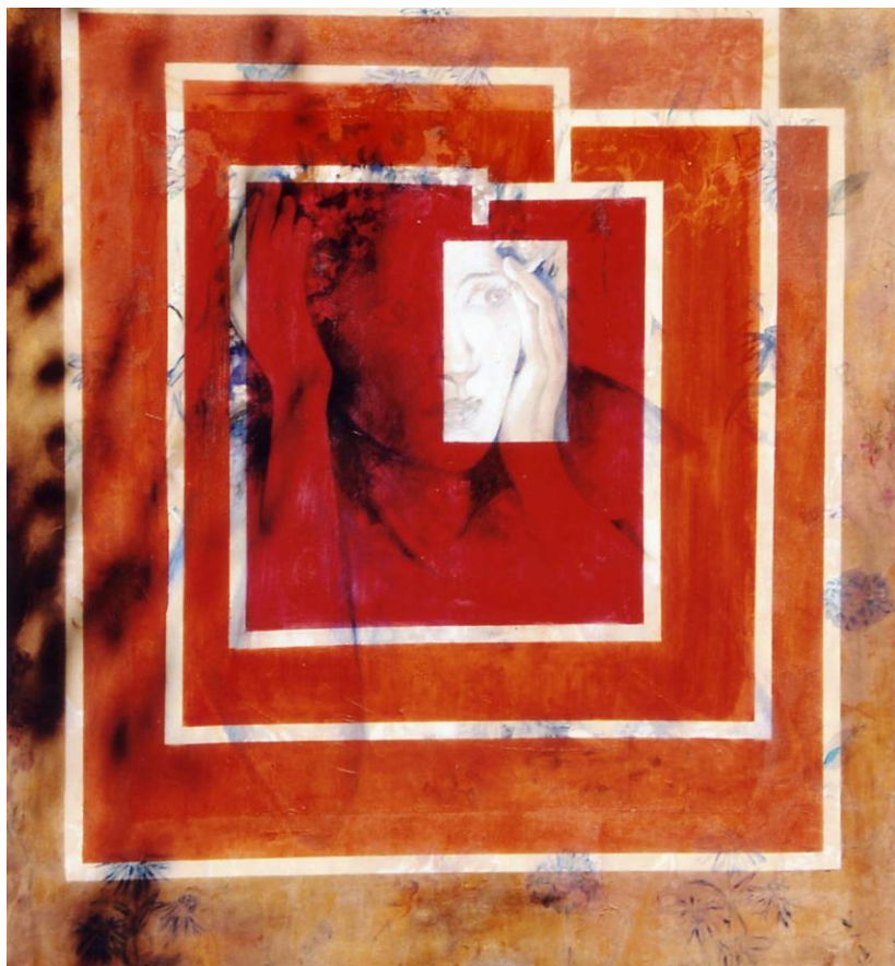
Autora: Diana Bekman Título: La ventana

Igualdad es luchar en contra del hostigamiento y acoso sexual por encima de todo, por ser una manifestación de las relaciones de poder. Las mujeres están mucho más expuestas a ser víctimas de este tipo de prácticas precisamente porque carecen de poder, se encuentran en posiciones más inseguras, les falta confianza en sí mismas, o han sido educadas por la sociedad para sufrir en silencio. Pero también corren peligro de padecer semejante conducta cuando se las percibe como competidoras por el poder.