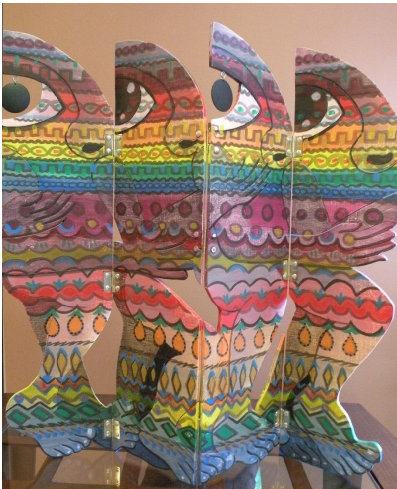
Autora: Graciela Ferreiro Título: Seres 2

Igualdad es la promoción de un lenguaje incluyente, que busca recordarnos que somos personas antes que mujeres y hombres. Es importante observar con mayor detenimiento las palabras orales y escritas que usamos, es una forma de reflexión y concientización, para darnos cuenta de que la humanidad está formada por dos sexos.